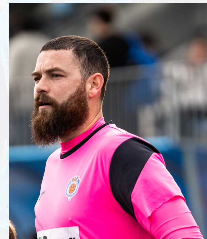
Entrenador Porteros F11 Academia Vicent Company