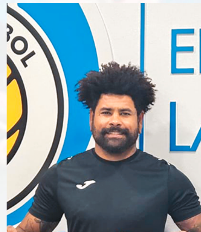
Entrenador Porteros F8 Academia Zeka