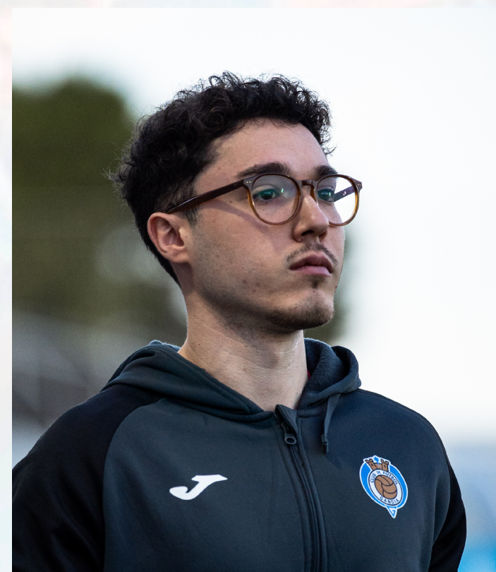
Fisioterapeuta Academia Miguel Ángel